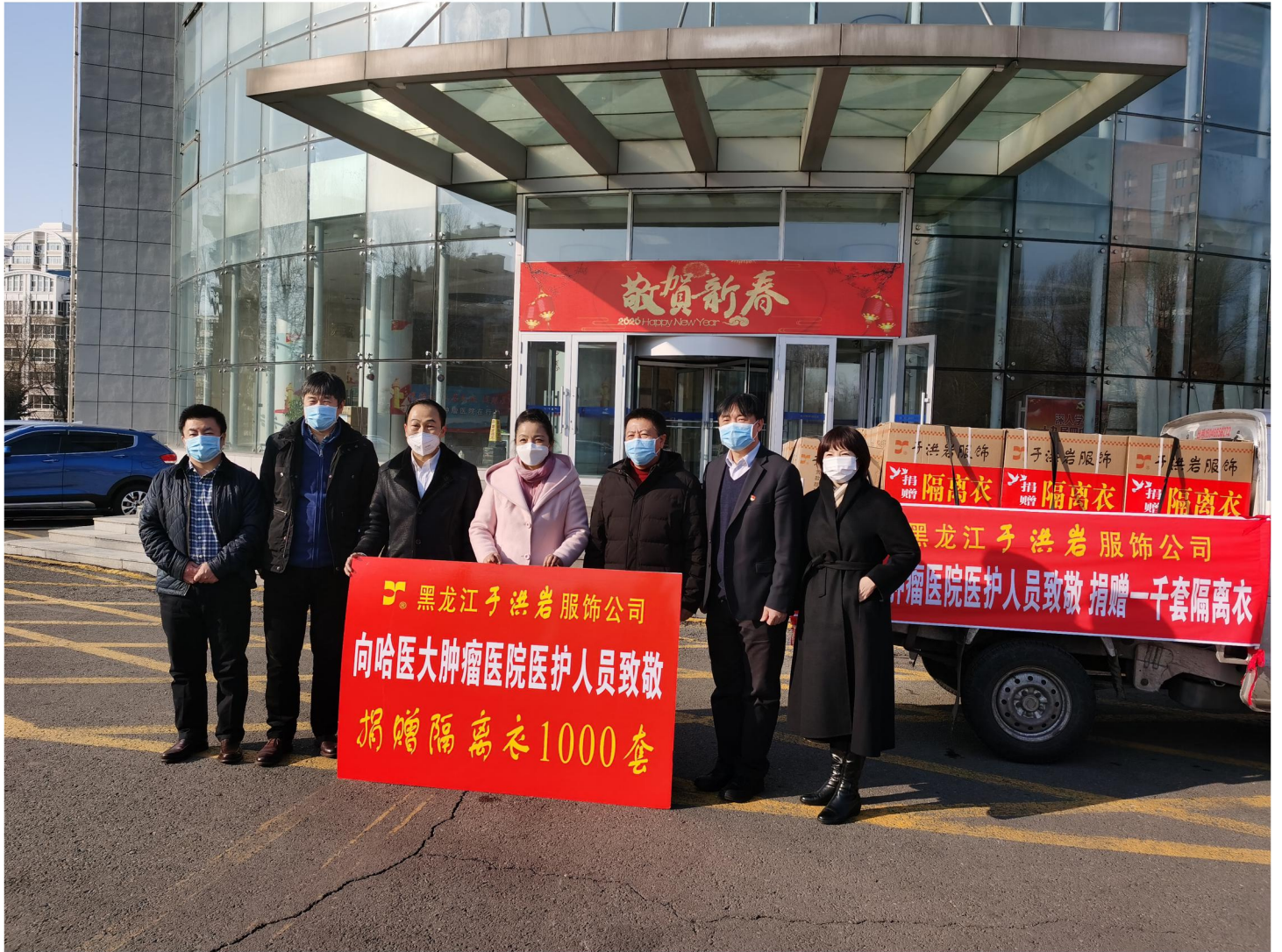
黑龙江洪岩服饰有限公司向哈医大肿瘤医院捐赠1000套隔离衣