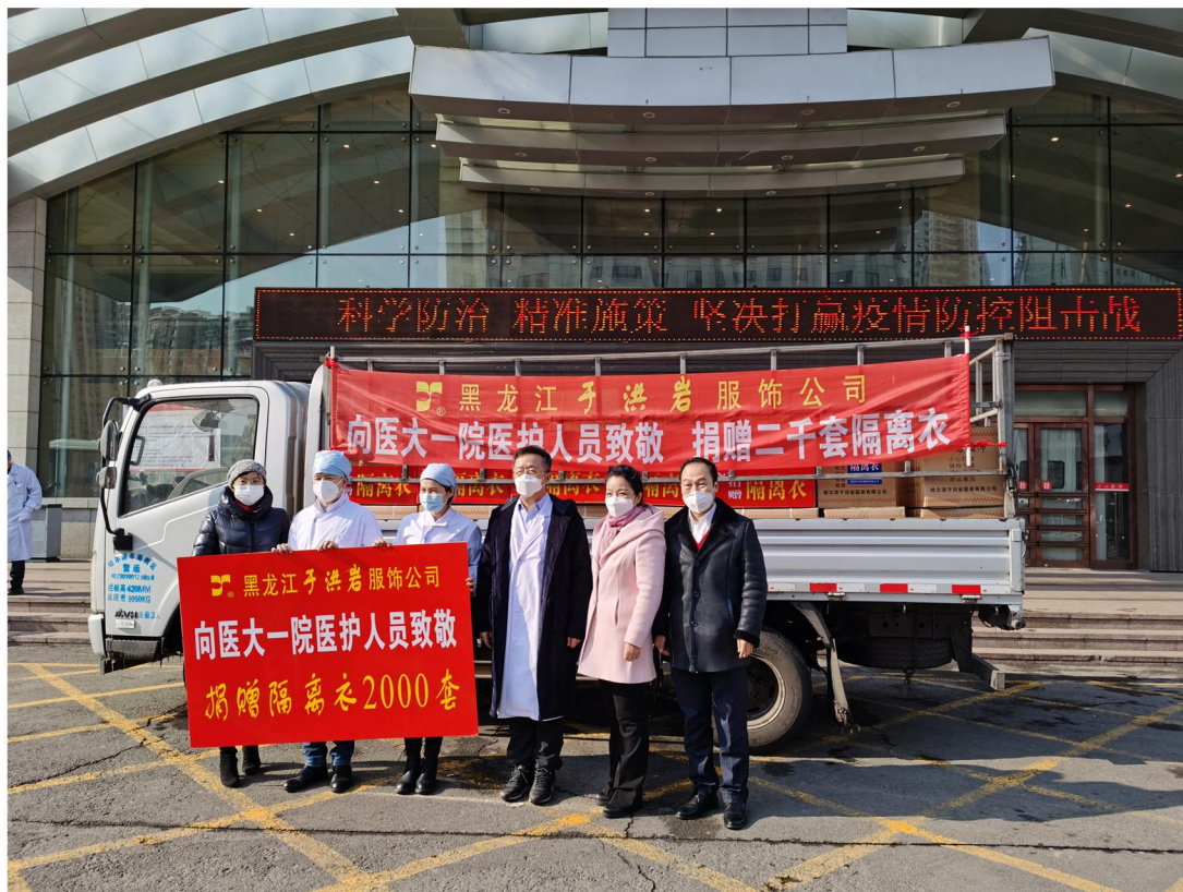
黑龙江洪岩服饰有限公司向收治全省新冠肺炎重症患者的哈医大一院群力院区捐赠2000套隔离衣