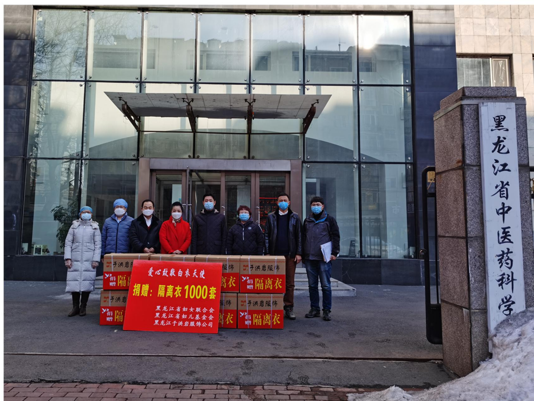
黑龙江洪岩服饰有限公司向黑龙江省中医药科学院、省中医大附属三院、省中医大附属四院捐赠2000套隔离衣