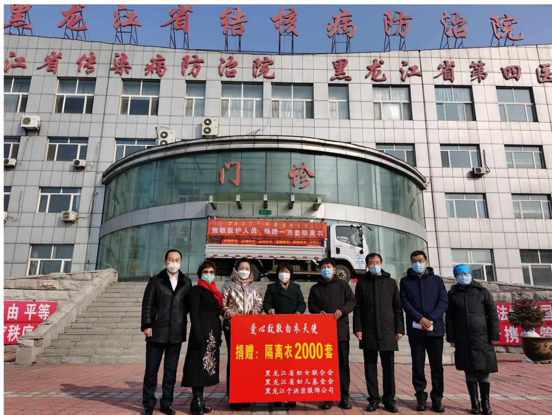
黑龙江洪岩服饰有限公司向黑龙江省传染病院捐赠2000套隔离衣