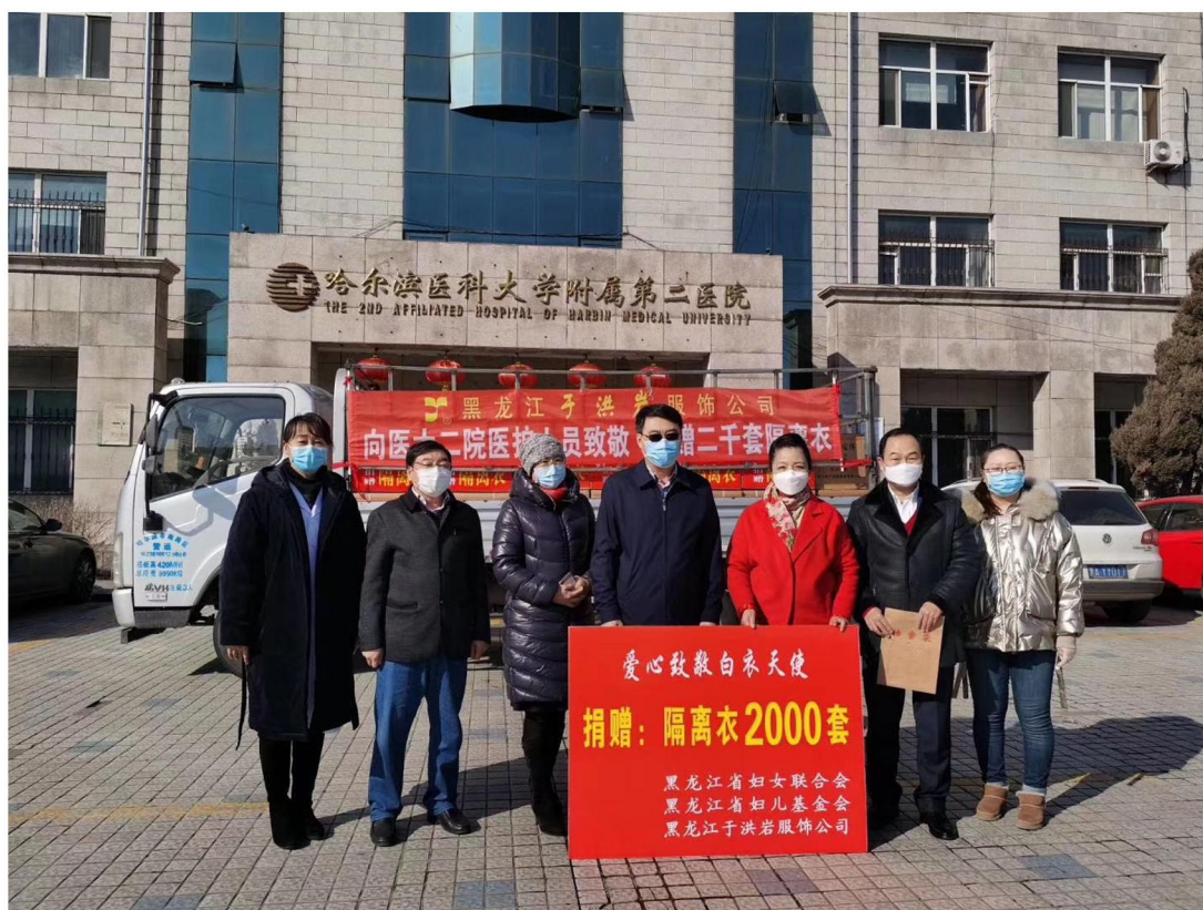
黑龙江洪岩服饰有限公司向哈医大二院捐赠2000套隔离衣